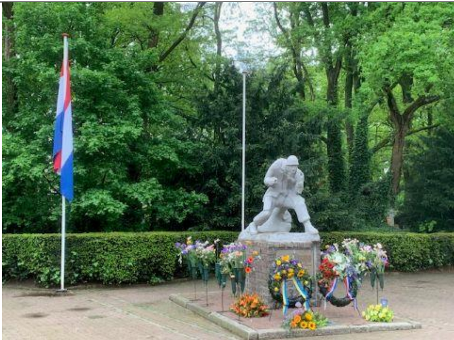
Herdenking mei 2024 in Son en Breugel