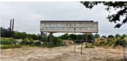
2014: Een brug van niets naar nergens

Rechtsaf. In 2014 was hier de enige nog werkende fabriek op complex R te zien ('Antheryon'; toen ik er werkte heette het nog Philips Optiek). In 2020 is ook die vervangen door woningen. Aan het einde van de weg rechtsaf de Zwaanstraat in, maar pas nadat de 'Zweedse huizen' aandacht hebben gekregen. Direct na de oorlog zijn veel van dit soort woningen gebouwd, uit bouwpakketten; nu zijn er weinig van over.