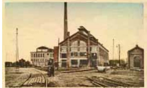
'De Nieuwe Glasfabriek'

De glasfabrieken van Philips. Het voortbestaan van Philips kwam in de Eerste Wereldoorlog in gevaar omdat de aanvoer van glazen ballons voor gloeilampen uit Duitsland stagneerde. In allerijl werd een eigen glasfabriek uit de grond gestampt; deze kwam in 1916 in bedrijf. Glasblazers en andere vaklieden moesten van elders worden aangetrokken (Maastricht, Leerdam, Nieuw-Buinen en later ook uit België, Duitsland en Tsjechië). Veelal werden zij in de woonwijken gehuisvest die Philips vanaf 1920 bouwde.