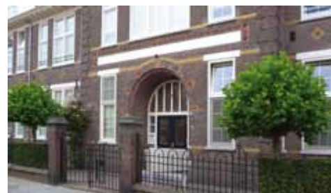
Voormalig gemeentelijk lyceum

Verderop bij het kruispunt rechtsaf naar het Lodewijk Napoleonplein; daar linksaf, doorsteken, de binnenring over en de Julianastraat in. Links is het voormalige Gemeentelijke Lyceum. Even kijken in de St. Catharinastraat, dan verderop op het plein de Prins Hendrikstraat in, halverwege