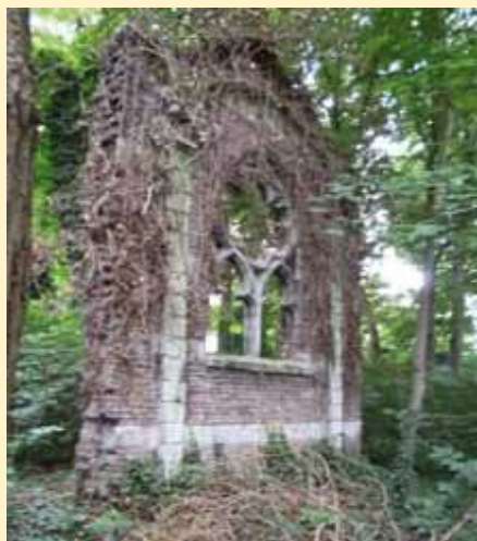
De namaakruïne van de pastoor

Achter de Sint Trudokerk ontstond een 'Urban Jungle' uit de verwaarloosde pastorietauin. Deze is zo groot omdat in 1884 de huidige kerk en bijbehorende pastorie zijn gebouwd op een groot, nog open terrein (de 'kerkackers'). De oude kerk stond aan de overkant van wat nu de Strijpsestraat heet.