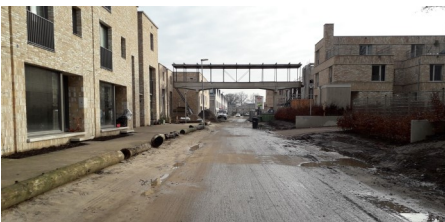
2020: Brug is er nog, zij het in beton; bestemming onbekend.

Terug naar de Zwaanstraat. De weg is het fietspad geworden met daarnaast de toegangsweg tot de wijk. De loopbrug tussen glasfabriek en beeldbuisfabriek staat er nog; in 2014 leidt hij van niets naar nergens. Hij moest behouden worden en dat is gebeurd: in 2020 in beton (GPS-spoor: Excursie loopbrug).