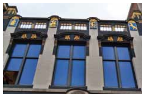
Mijn favoriet: Jugendstil aan de Marktstraat