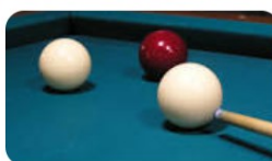
Biljartclub 'de Doorschieters' >