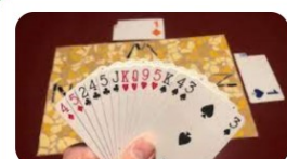
Bridgeclub 'het Schouwspel' >

Bij PVGE Eindhoven zijn een groot aantal clubs actief