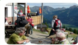
Bergwandclub 'de Gemzen' >