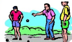
Jeu de Boulesclub 'de Keilers' >