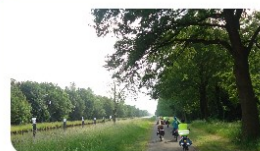
Fietsclub 'de Schouw' >