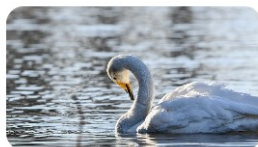
Fotoclub 'de FotoSchouw' >