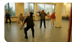
Bewegen met Thai Chi >

Coördinator MCTOP heeft een korte promotie-video gemaakt voor MCTOP, teneinde nieuwe leden te werven. Hij gaat, als lid van PVGE-Eindhoven, dit ook doen voor Eindhovense clubs.