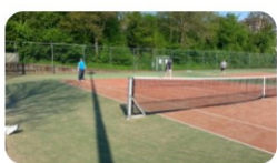
Tennisclub 'NogFit' >