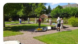
Midgetgolf 'de Golfijnen' >