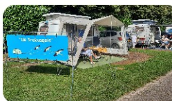
Kampeerclub 'de Trekvogels' >