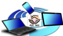
Computerclub 'PCC' >