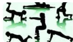
Gymnastiek 'GYM 55' >